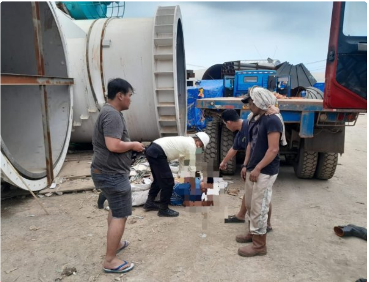
Pelaku Narkotika diringkus aparat Polres Morowali

MOROWALI, Sulawesi Tengah- Personel Satresnarkoba Polres Morowali