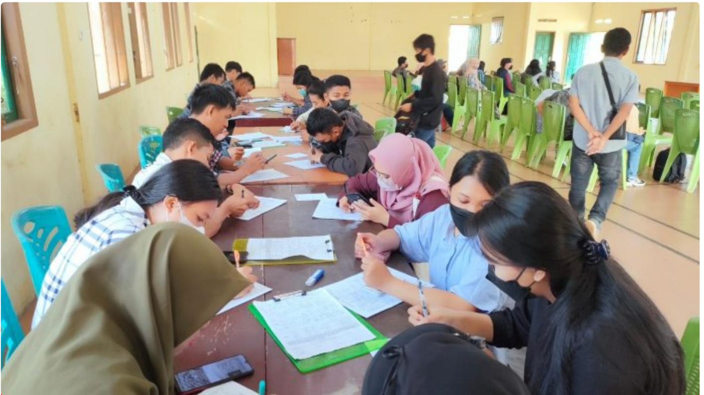
Tampak Antusias Pencaker Ikuti Job fair yang digelar PT GNI di Desa Molino

MOLINO, Morut Sulteng- PT Gunbuster Nickel Industry (GNI) secara beruntun melakukan Job Fair atau perekrutan langsung di sejumlah Desa Kecamatan Petasia Timur, Kabupaten Morowali Utara (Morut).